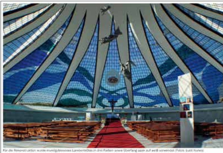
Für die Rekonstruktion wurde mundgeblasenes LambertsGlas in drei Farben sowie Überläng span auf weiß verwendet

Anlässlich des 50-jährigen Bestehens der am Reißbrett entworfenen Hauptstadt von Brasilien wurde auch ihr Wahrzeichen – die Kathedrale von Oscar Niemeyer – restauriert. Die Arbeiten fanden unter Aufsicht des Instituts des nationalen historischen und künstlerischen Erbes (IPHAN) statt.